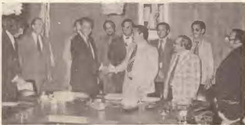
Acuerdo logra cu Philips pa proyecto di telefon.

Gobierno Insular ta haciendo tur empeño pa completa e proyecto cual originalmente lo a dura 2 aña, pa fin di e aña aki. Di e manera aki e pueblo di Aruba lo por disfruta di un mehor servicio telefonico lo mas pronto posible.